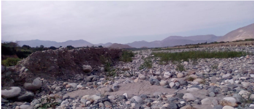
FIGURA N°1 TRAMO DEL CAUCE DEL RIO LOCO COLMATADO, UNA ALTURA APROXIMADAMENTE DE 0.60M.