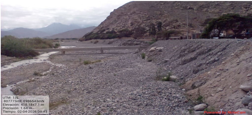
FIGURA N°02.- EN LA FOTOGRAFIA EL DIQUE DE LA MARGEN IZQUEIRDA BUEN ESTADO Y EL DIQUE DE LA MARGEN DERECHO EROSIONADO.